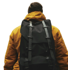
THANH HUYNH TRAVAILLEUR DE RUE

POUR L'ANNÉE FINANCIÈRE EN COURS, L'ENSEMBLE DES EMPLOYÉS ONT TRAVAILLÉS UN TOTAL DE 18 870 HEURES