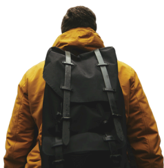
ÉMILIE CARTIER BARRIÈRE TRAVAILLEUSE DE RUE